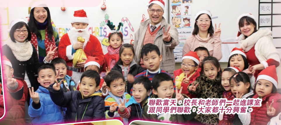
聯歡當天，校長和老師們一起進課室跟同學們聯歡，大家都十分興奮。