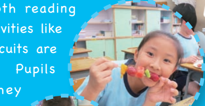
It's so yummy and healthy!