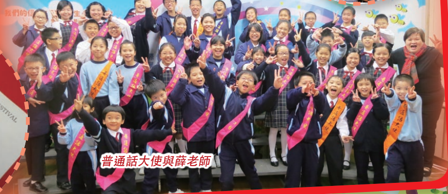
普通話大使與薛老師