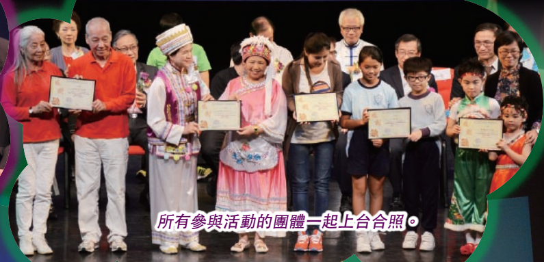
所有參與活動的團體一起上台合照。