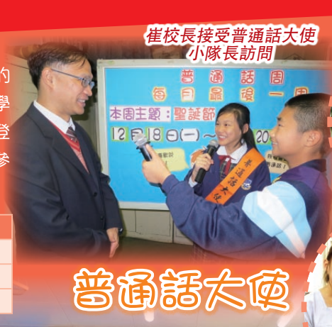
崔校長接受普通話大使小隊長訪問