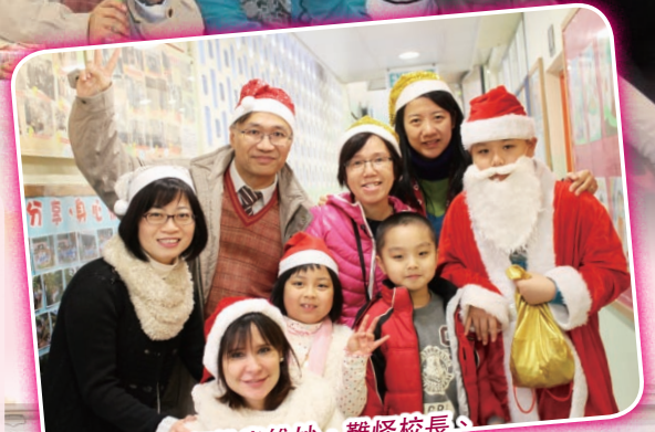
聖誕老人扮相維肖維妙，難怪校長、老師和同學們都想跟他合照。

2013年12月20日是學校的聖誕聯歡日，主題為「感恩・分享」。當天學校邀請了中華基督教禮賢會香港堂，聯同一些不同國籍人士來作嘉賓，他們給同學們表演和分享，還派給每個同學一份小禮物，大家都興奮極了。此外，為增添聖誕歡樂氣氛，校長及外籍老師更聯同合唱團同學一起獻唱聖誕樂曲，而非洲鼓校隊同學亦跟來自非洲的嘉賓一起表演非洲鼓，大家都過了一個既歡樂又難忘的聖誕聯歡會。