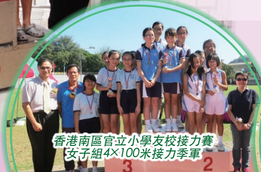
香港南區官立小學友校接力賽 女子組4×100米接力季軍