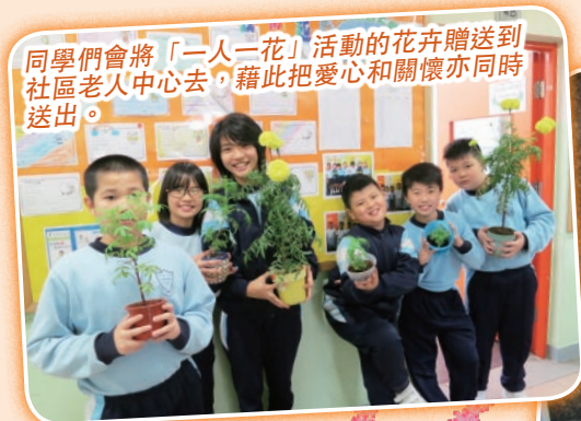
同學們會將「一人一花」活動的花卉贈送到社區老人中心去，藉此把愛心和關懷亦同時送出。