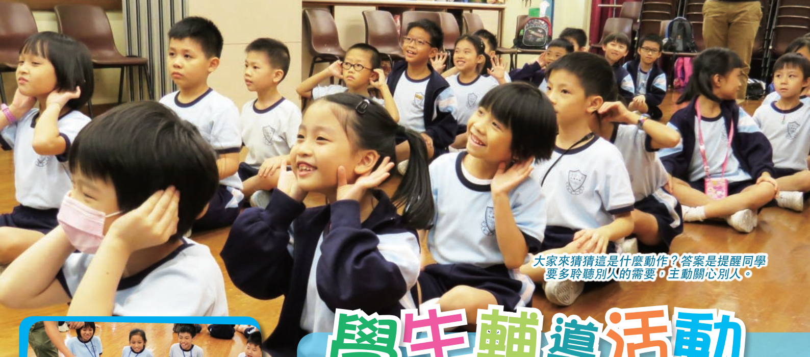
大家來猜猜這是什麼動作？答案是提醒同學要多聆聽別人的需要，主動關心別人。