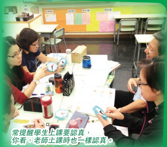
常提醒學生上課要認真，你看，老師上課時也一樣認真。