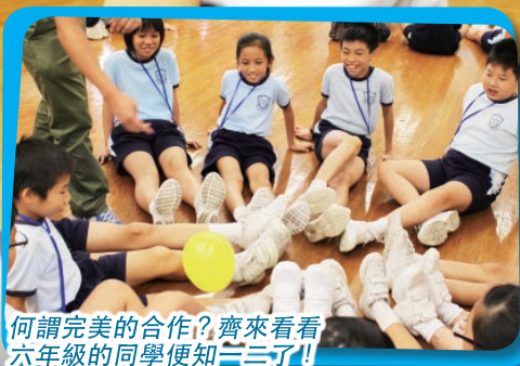
何謂完美的合作？齊來看看六年級同學便知一二了！

有鑒於從小建立孩子正確價值觀是一件很重要的事，因此本校今年繼續與東華三院學生輔導服務合作，按各級學生的需要於放學後時段(指定星期五)而推行不同主題的輔導活動。希望透過輕鬆互動的方式，引導學生反思個人的價值觀，藉以提升學生身心靈的健康為目標。