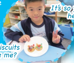
Do the biscuits look like me?