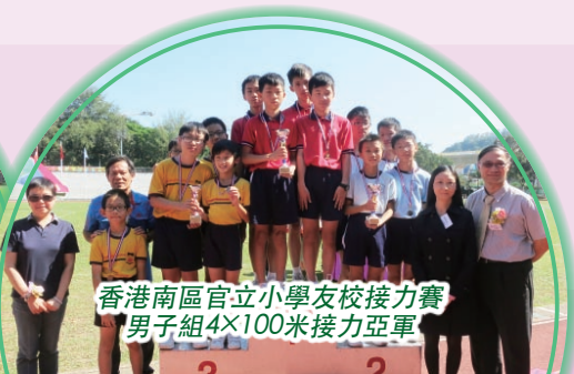
香港南區官立小學友校接力賽 男子組4×100米接力亞軍