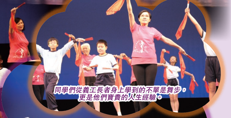
同學們從義工長者身上學到的不單是舞步，更是他們寶貴的人生經驗。