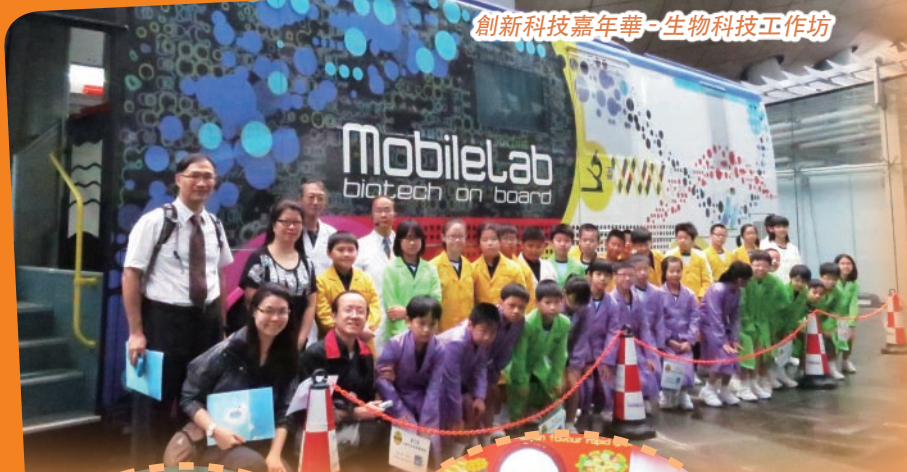
創新科技嘉年華-生物科技工作坊

本校常識科設校本課程，為學生安排多元化的學習活動，包括專題研習、參觀、生物科技工作坊、科技及科學探究活動，還舉辦了多項有關健康生活、德育、公民及國情教育的活動，如「惜飲惜食行動」、「沖沖水5分鐘」及「基本法及國民常識問答比賽」等。為增強學生的時事觸覺及對事物的分析能力，本校在課堂上設時事分享時段，鼓勵學生發表己見，並利用學習日誌分享感受及得著。