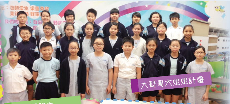
大哥哥大姐姐計劃