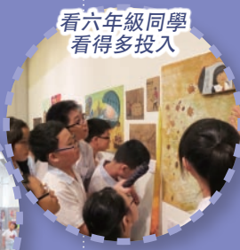
看六年級同學看得多投入