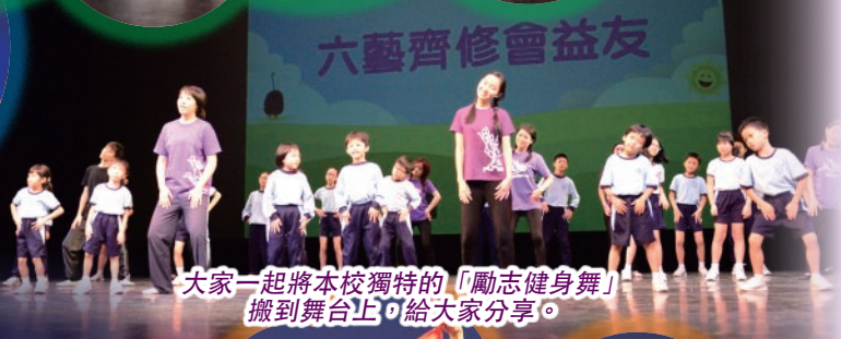
大家一起將本校獨特的「勵志健身舞」搬到舞台上，給大家分享。