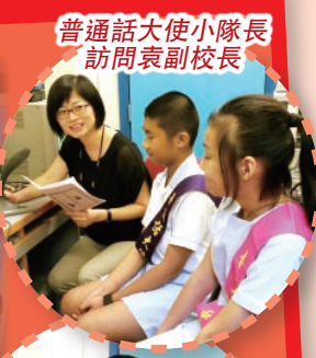
普通話大使小隊長訪問袁副校長