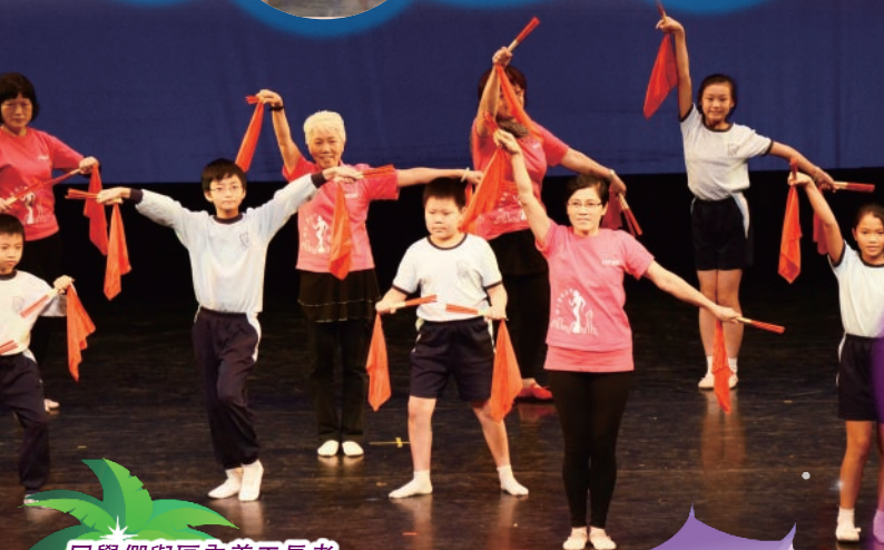
同學們與區內義工長者正演出「健康中國舞」。