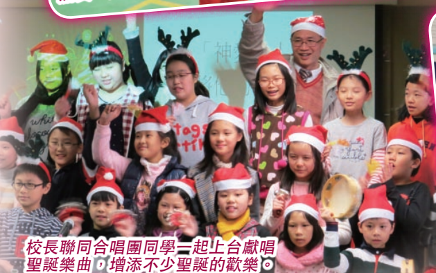
校長聯同合唱團同學一起上台獻唱聖誕樂曲，增添不少聖誕的歡樂。