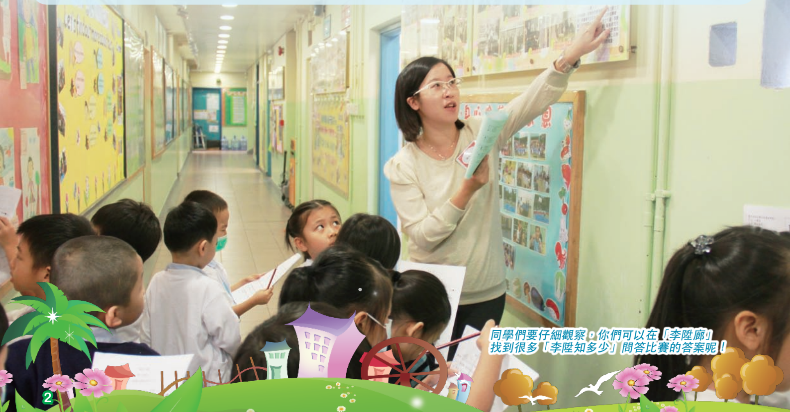
同學們要仔細觀察，你們可以在「李陞廊」找到很多「李陞知多少」問答比賽的答案呢！