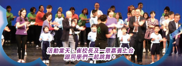
活動當天，崔校長及一眾嘉賓上台跟同學們一起跳舞。