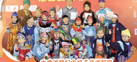
大會頒發紀念狀予非洲鼓隊