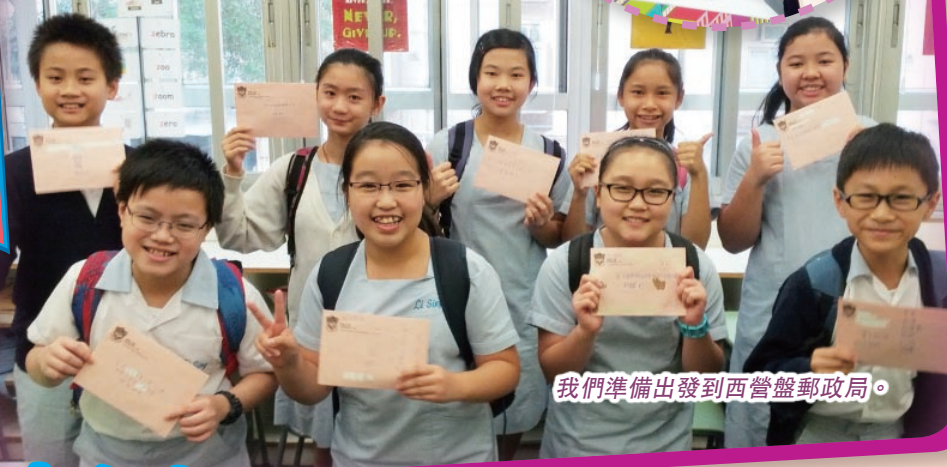
我們準備出發到西營盤郵政局。