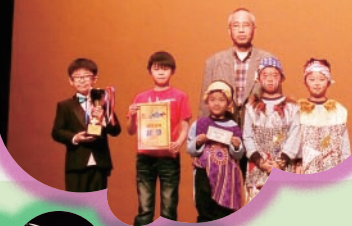
兩隊代表上台領獎