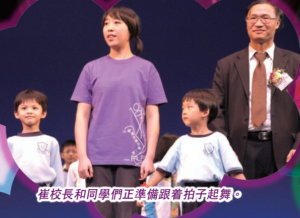
崔校長和同學們正準備跟着拍子起舞。