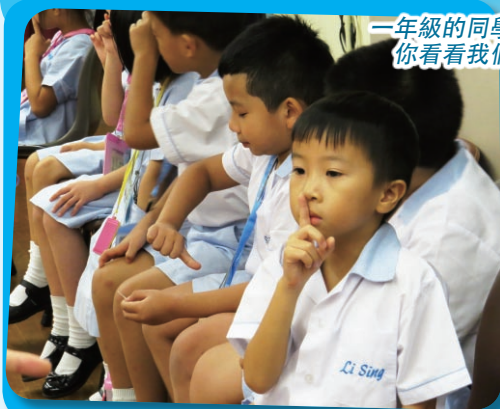
一年級同學正在學習安靜守規，你看我們是否很像樣呢？！