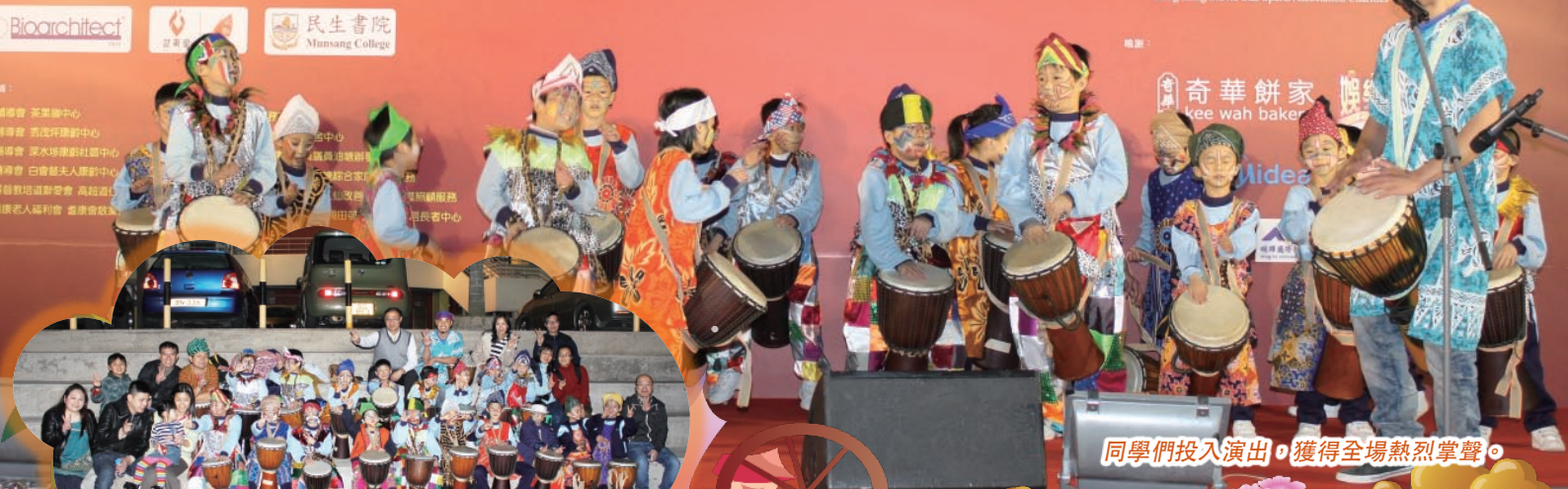
同學們投入演出，獲得全場熱烈掌聲。