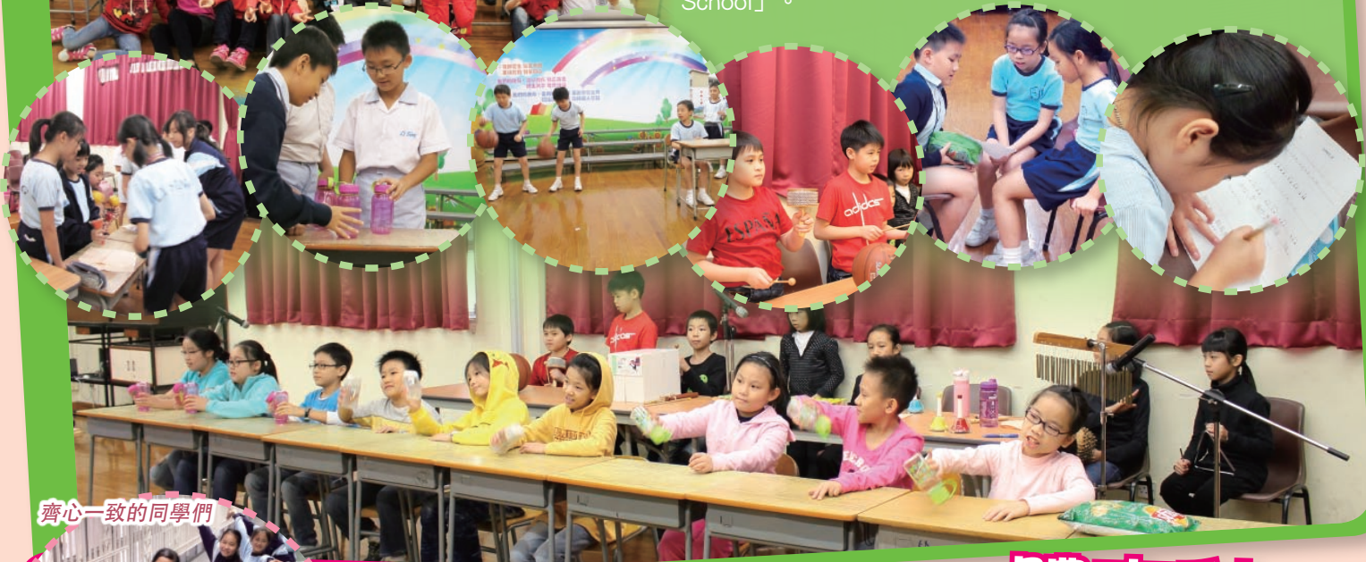
齊心一致的同學們