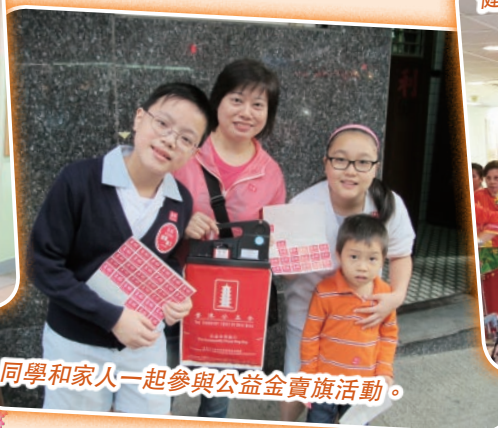
同學和家人一起參與公益金賣旗活動。