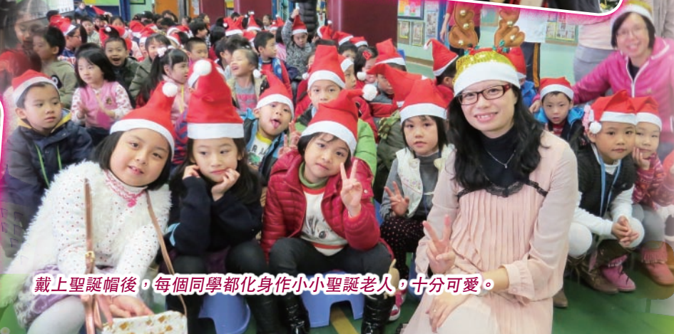
戴上聖誕帽後，每個同學都化身作小小聖誕老人，十分可愛。