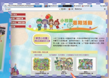
賀正同學獲勝作品