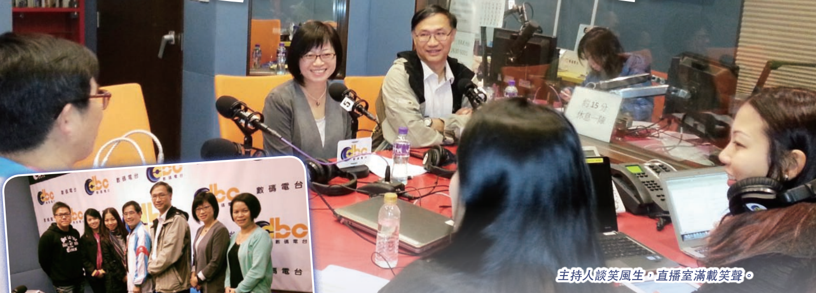
主持人談笑風生，直播室滿載笑聲。