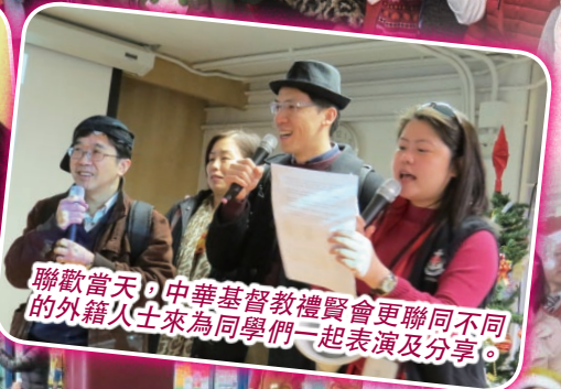
聯歡當天，中華基督教禮賢會更聯同不同的外籍人士來為同學們一起表演及分享。