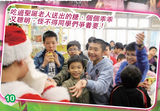
吃過聖誕老人送出的糖，個個乖乖又聰明，怪不得同學們爭着要！