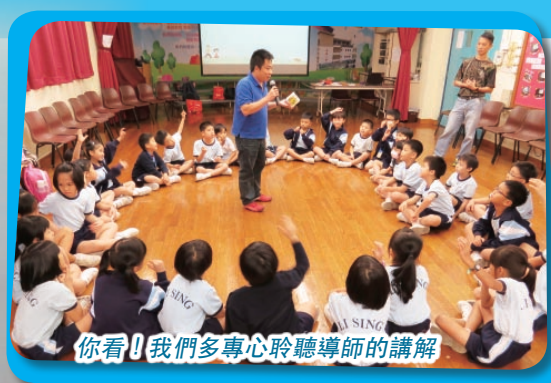
你看！我們多專心聆聽導師的講解