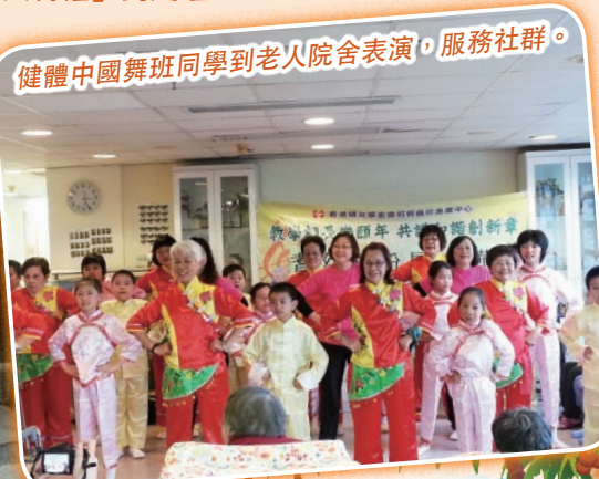
健體中國舞班同學到老人院舍表演，服務社群。