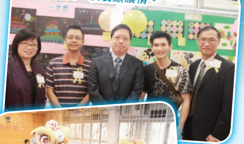
李陞校祖日，校友顯濃情。

希望李陞小學的學生常懷感恩之心，對自己的成長好好回顧和反思，定立目標，勇敢啟航。