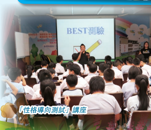
「性格導向測試」講座