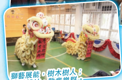
獅藝展能，樹木樹人； 李陞精神，敬業樂群。