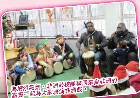
為增添氣氛，非洲鼓校隊聯同來自非洲的嘉賓一起為大家表演非洲鼓。