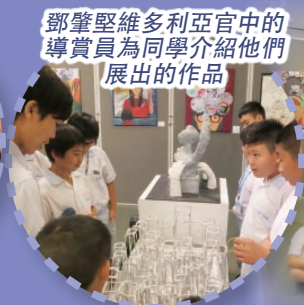
鄧肇堅維多利亞官中的導賞員為同學介紹他們展出的作品