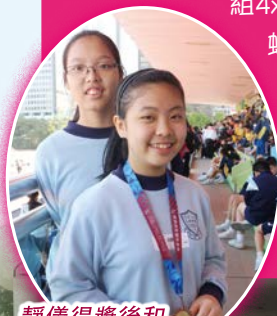
靜儀得獎後和雨晴分享喜悅