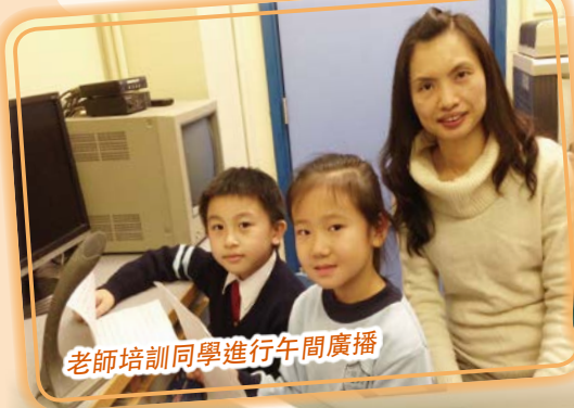
老師培訓同學進行午間廣播