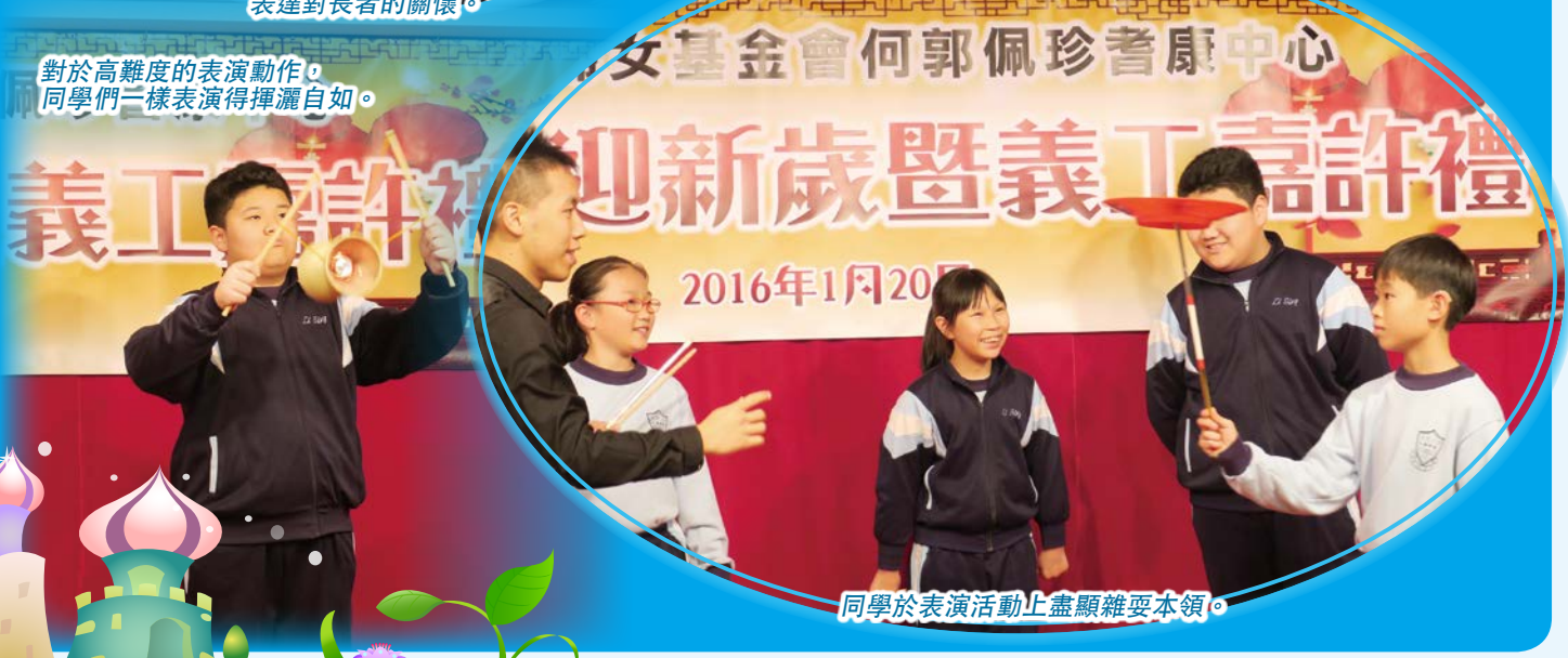
同學於表演活動上盡顯雜耍本領。