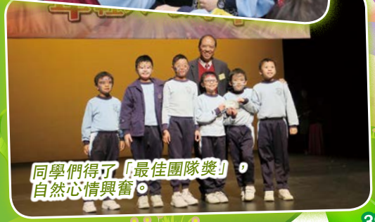
同學們得了「最佳團隊獎」，自然心情興奮。