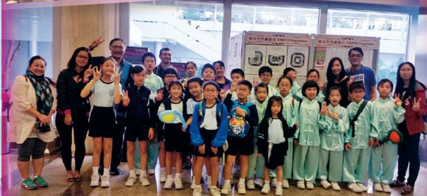
校長、老師、家長和同學們一起參與和支持社區共融齊起舞。