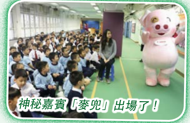
神秘嘉賓「麥兜」出場了！