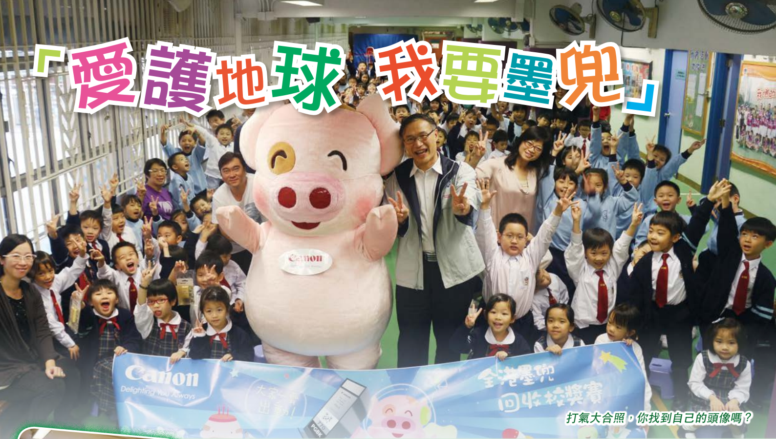
打氣大合照，你找到自己的頭像嗎？

為了愛護地球，給學生認識環保的重要性，本校在十二月生活教育時段為學生舉行了一場宣揚環保訊息的講座，當天主講嘉賓講解了溫度上升，全球暖化將會對我們帶來的影響。在講座完結時，驚喜出現了！卡通人物「麥兜」專程到校為我們打氣！希望同學都能為環保出一分力，齊心愛護我們的家。最後「麥兜」還和全體學生拍照留念呢！