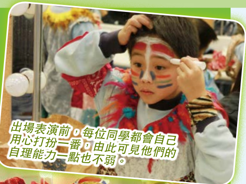
出場表演前，每位同學都會自己用心打扮一番，由此可見他們的自理能力一點也不弱。

為了讓學生有更多的課外學習經驗及提升他們的自信心，本校非洲鼓校隊於17-12-2015參加了由中環及半山分區委員會、中西區區議會、中西區民政事務處及中西區校長聯會主辦之「年輕人藝術展才華」。當晚各隊表演隊伍來自中西區，可謂精英群集，而本校之非洲鼓校隊更有幸榮獲「最佳團隊獎」。