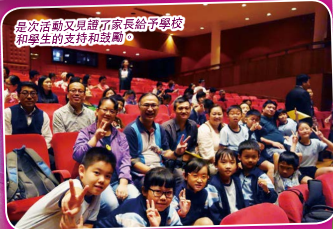
是次活動又見證了家長給予學校和學生的支持和鼓勵。