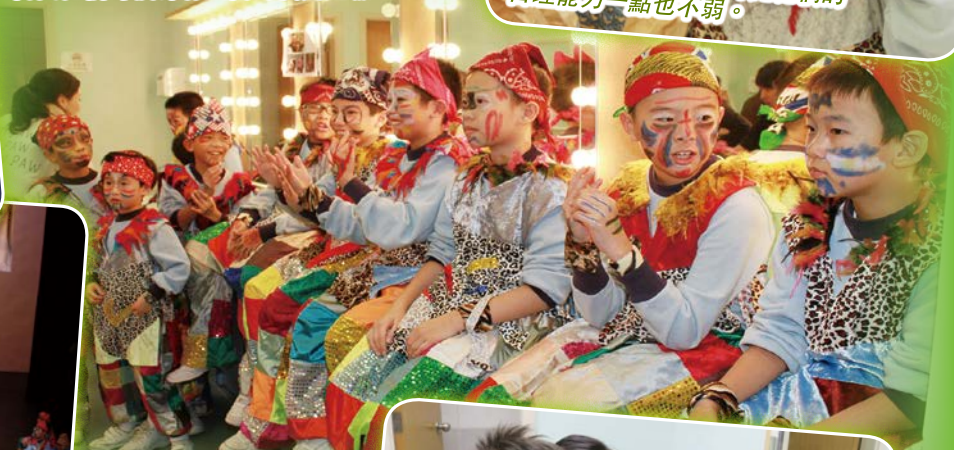
同學們在後台等待時心情輕鬆愉快，皆因他們每個都有豐富的演出經驗。