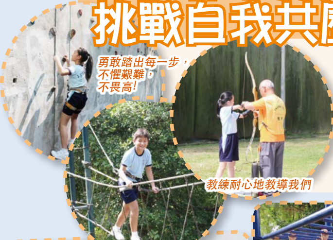
教練耐心地教導我們

本年度的秋季旅行於2015年10月23日在曹公潭戶外康樂營舉行，主題是「自律守紀齊環保，挑戰自我共歷奇」。本校藉此旅行培養學生過團隊生活，享受於大自然中進行健康活動的樂趣，增進學生的課外群性學習經驗及欣賞大自然的能力。今年學生還要和組員一起在營地找出班徽呢！