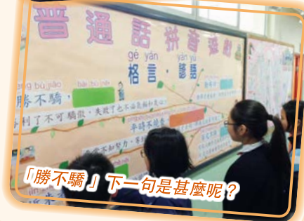
「勝不驕」下一句是甚麼呢？