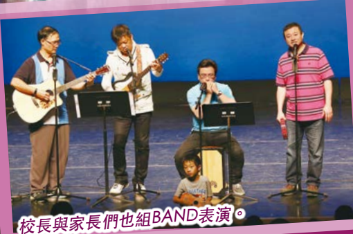
校長與家長們也組BAND表演。