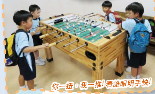
你一扭，我一推！看誰眼明手快！