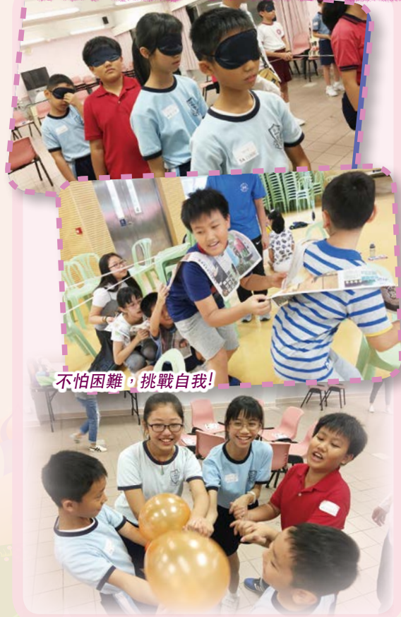
不怕困難，挑戰自我！