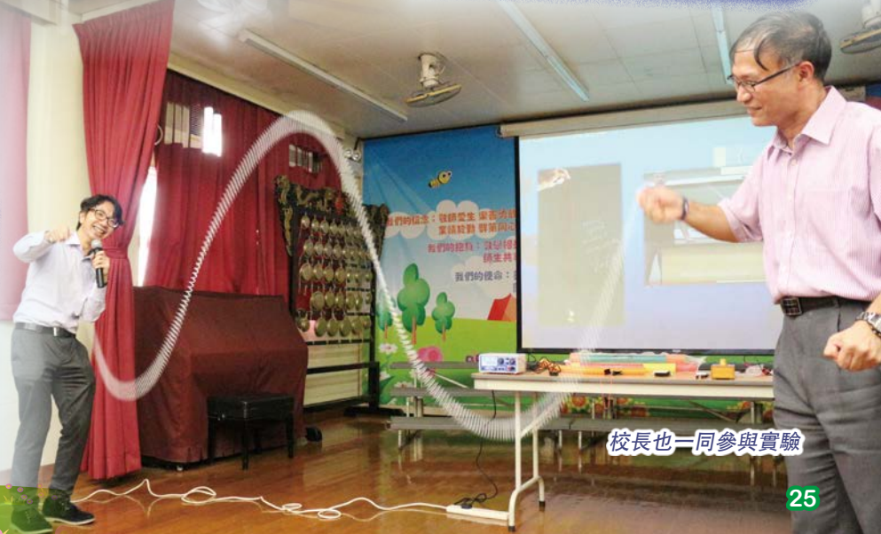
校長也一同參與實驗