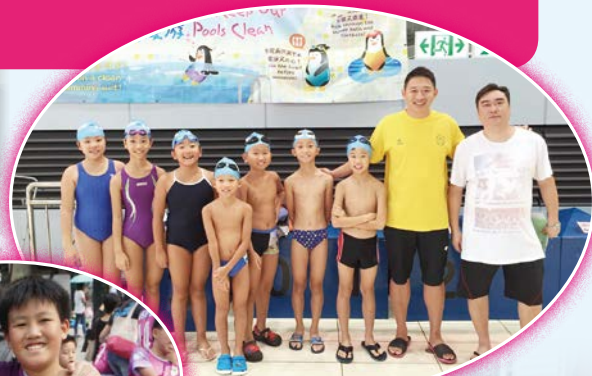
整裝待發，全力以赴