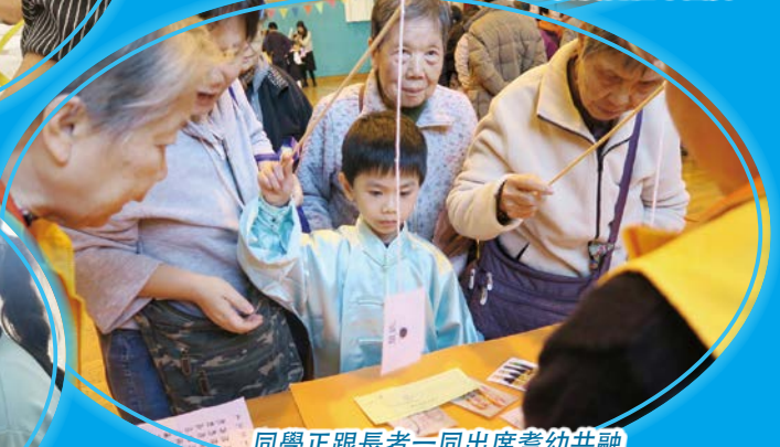
同學正跟長者一同出席耆幼共融嘉年華，長幼共融，一起學習，一起活動，薪火相傳。