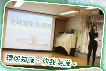
環保知識，你我共識。

另外，本校也有為環保出力，連續第三年參加由香港佳能主辦的「全港墨兜回收校獎賽」。過去兩年，本校都在「最高回收人均比例獎」中得到第三名。本年度的截止時間將會定於四月，各位家長、同學，如果你們有用完的墨兜(不限牌子)，記緊帶回學校交給陳SIR，每五個回收墨兜都可得到一支限量版麥兜原子筆呢！