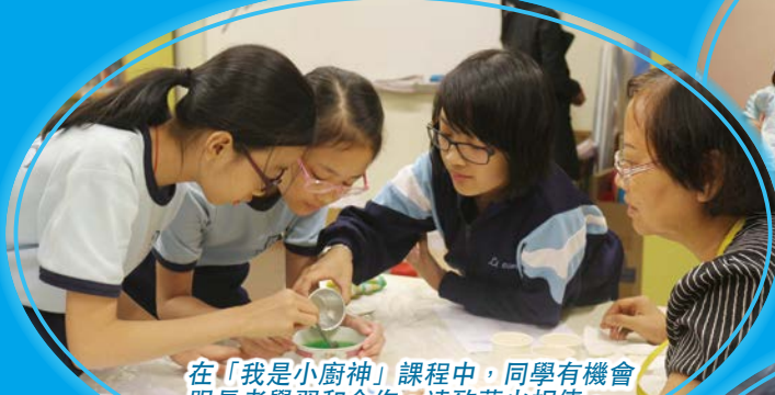
在「我是小廚神」課程中，同學有機會跟長者學習和合作，達致薪火相傳。