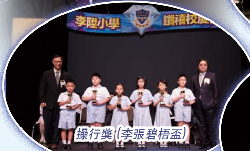
操行獎(李張碧梧盃)