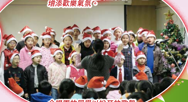
合唱團的同學以悅耳的歌聲來跟大家慶祝聖誕。