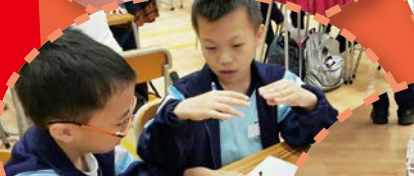
訂定原來的設計，令設計變得可行。