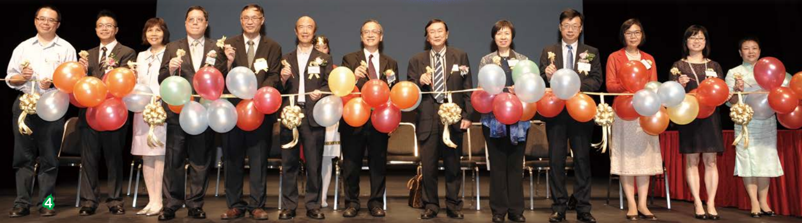
「鑽慶音樂劇」啟動禮