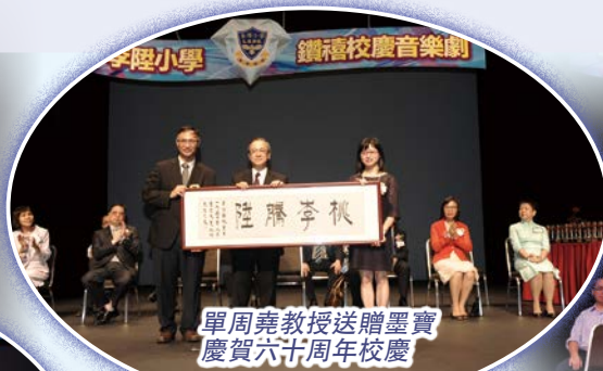
單周堯教授送贈墨寶 慶賀六十周年校慶