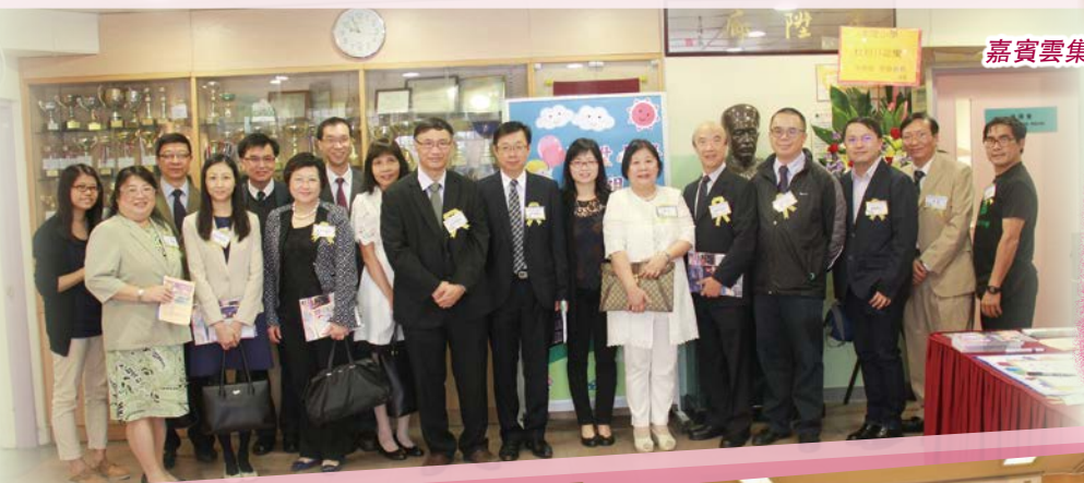
嘉賓雲集，濟濟一堂！