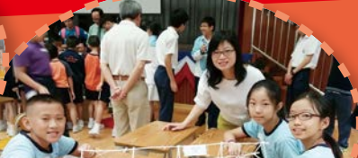
袁副校長與其中一隊合照。