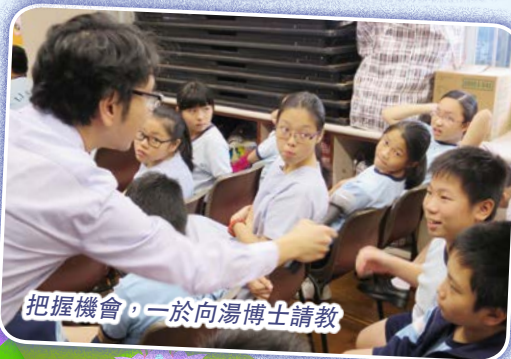
把握機會，一於向湯博士請教