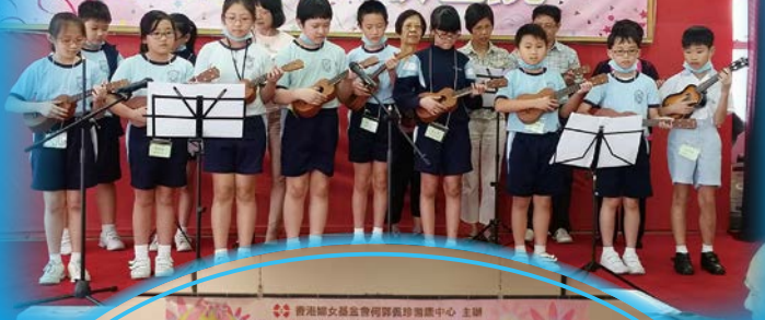
「小結他」班的學員跟長者一起到護理院去作表演服務。

本校自2013年起，建立了一隊龐大的學生義工服務隊伍——「陸星義工隊」，與「香港婦女基金會何郭佩珍耆康中心」緊密合作，每年透過申請各項基金，開辦了3個學生與長者共同學習，一起參與服務的興趣班，包括「健康美食工作坊」、「健體中國舞」、「小結他」、「我是小廚神」、「雜耍樂」等等，引入社區資源，提升學生生活技能，引領他們建立正確價觀，學懂與長者相處，並共同服務。