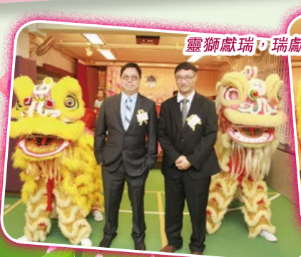
靈獅獻瑞，瑞獻李陞。