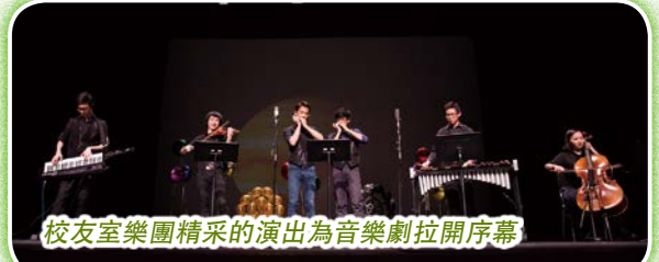
校友室樂團精采的演出為音樂劇拉開序幕