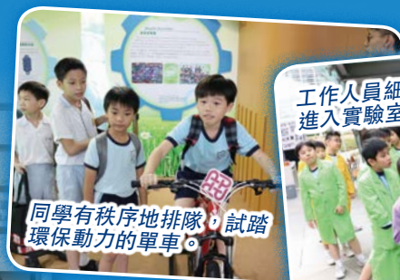
同學有秩序地排隊，試踏環保動力的單車。