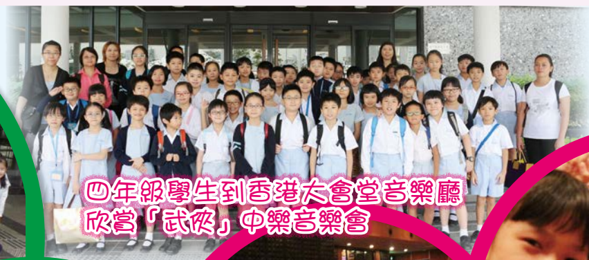
四年級學生到香港大會堂音樂廳欣賞「武俠」中樂音樂會