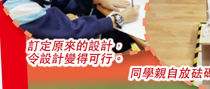
同學親自放砝碼作重量測試。