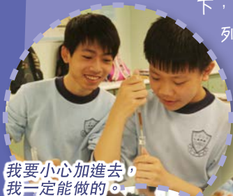
我要小心加進去，我一定能做的。