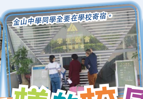
金山中學同學全要在學校寄宿。