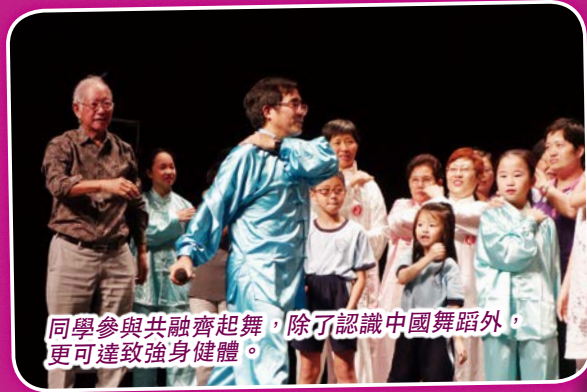
同學參與共融齊起舞，除了認識中國舞蹈外，更可達致強身健體。