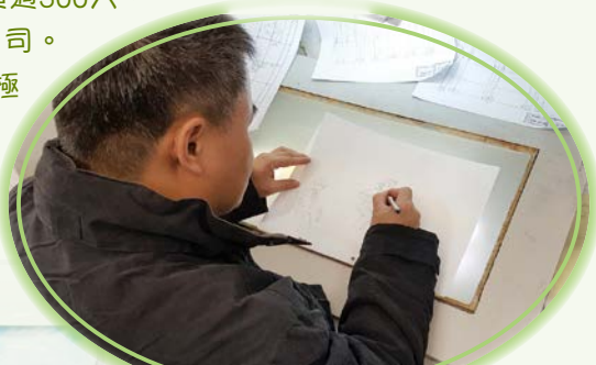
製作總監及畫師與我們分享製作心得

“方塊”一直致力發展具中國特色的民族動漫文化產業，以積極打造有“中國風格、中國氣派、中國精神”的民族動畫品牌為使命。原來不少出色的動畫例如：《甜心格格》、《正義紅獅》、《老夫子》、《風雲訣》及《家燕媽媽》等都是該公司的作品。當日導演還親自與同學面談，分享漫畫製作的心得。