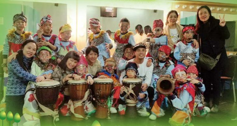
比賽當天，家長、導師都全力支持，同學們自然落地地表演。