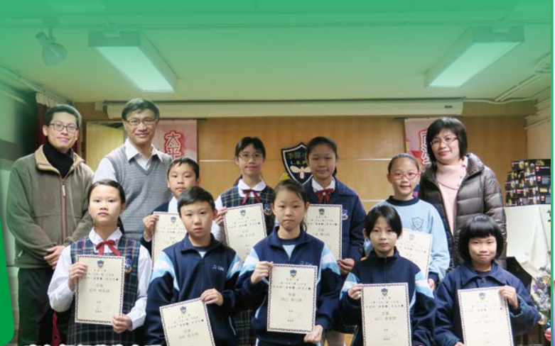
高年級得獎生合照