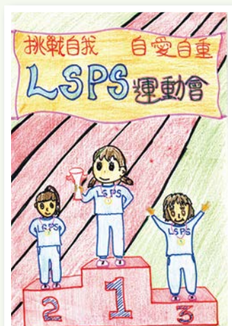
運動會場刊封面設計比賽低級組季軍 2B 李子瑤