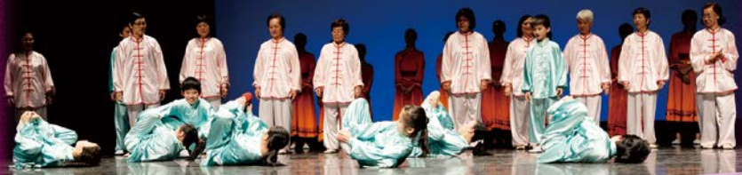
同學們跟長者一起表演，並落力投入於每個動作中。