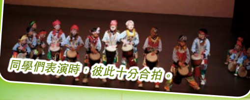
同學們表演時，彼此十分合拍。