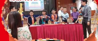
一眾同學走出來參與聲波的實驗。