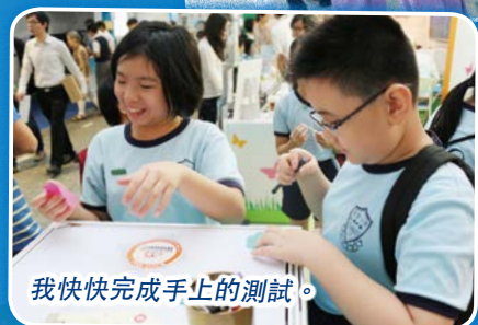
我快快完成手上的測試。