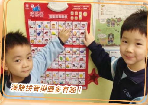
漢語拼音掛圖多有趣！