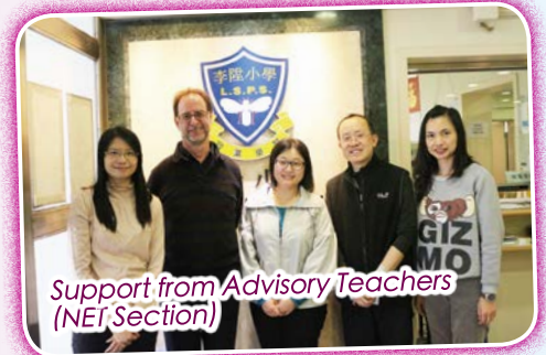
Support from Advisory Teachers (NET Section)