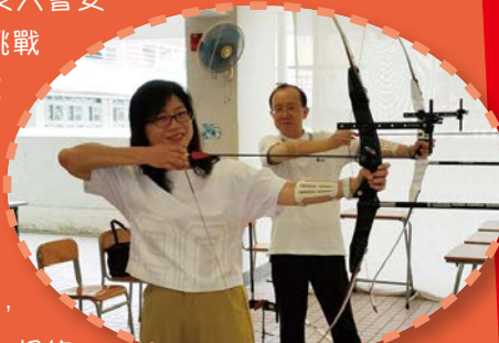
體驗中學校園生活——學習射箭

排的砝碼重量測試，這是極具挑戰的科研活動。大會還安排中文大學物理系星級講師湯兆昇博士主持有關聲音的科學講座，同學們都說獲益良多。能完成一項集創意思維與科研應用於一身的任務，既為各人帶來一份滿足感，也為各人對科研增加一份的熱愛，相信是次參賽的最大收穫。