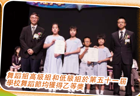
舞蹈組高級組和低級組於第五十一屆學校舞蹈節均獲得乙等獎