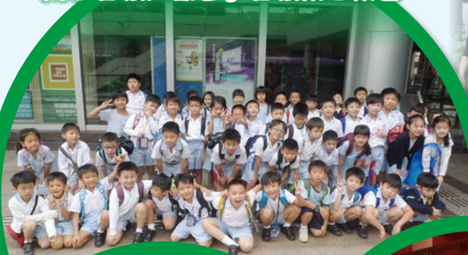
二年級學生到荃灣大會堂演奏廳欣賞「走進管弦大觀園」管弦樂音樂會

此外，校方善用社區資源，安排了大約一百位學生及家長免費欣賞現場音樂會——「庇理羅士管樂團周年音樂會2015」彼得與狼。樂團用新穎的手法介紹音樂，運用生動的旁白和個性鮮明的角色扮演，讓觀眾一邊聽故事，一邊欣賞音樂，令學生大開眼界。