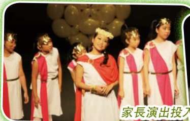
家長演出投入，是好戲之人。

「鑽禧校慶音樂劇」——《在宇宙間起舞》是集合了中文話劇組、非洲鼓隊、東方舞組、健體操大使及合唱團多個表演團隊的大型表演節目。當晚更邀請了熱愛音樂的校友們組成室樂團，為音樂劇演奏序曲，並邀請了家長粉墨登場。師生、家長、校友，以及各界友好參與其中，同賀鑽禧。