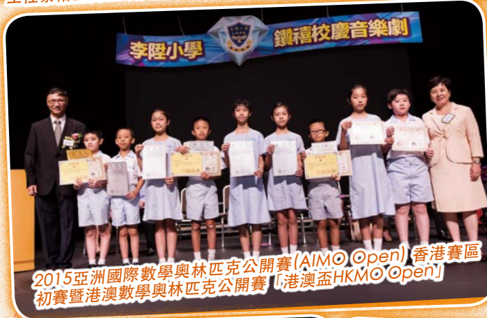
2015亞洲國際數學奧林匹克公開賽(AIMO Open)香港賽區初賽暨港澳數學奧林匹克公開賽「港澳盃HKMO Open」