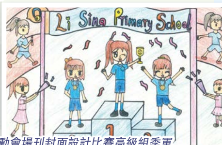
運動會場刊封面設計比賽高級組季軍 6A 蔡舒雯

除了參加比賽外，六年級學生更於2016年1月27日參觀了香港文化博物館，展覽的主題為「祝福的印記——傳統童服裏的故事」。同學們在是次參觀中認識了不少中國傳統的兒童服飾如帽子、坎肩、女褂等，服飾上的動物或圖案有其傳統的象徵意義，同學們獲益不少！