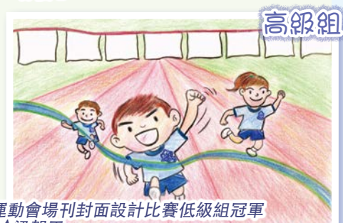
運動會場刊封面設計比賽低級組冠軍 4A 梁賀正