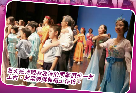
當天就連觀看表演的同學們也一起上台，起動參與舞蹈工作坊。

為提供藝術教育平台，讓學生對中國舞蹈文化有所認識，並藉此透過藝術學習，分享和欣賞，表達對社會關心之情，本校於2015年11月22日安排學生出席「社會共融齊起舞」活動。當天學生分別跟不同的藝術或義工團隊演出，並由業餘中國舞推廣中心創辦人鄧文輝導師帶領下，演出由他首編之勵志健身舞，將健康及生命的訊息傳至社區。