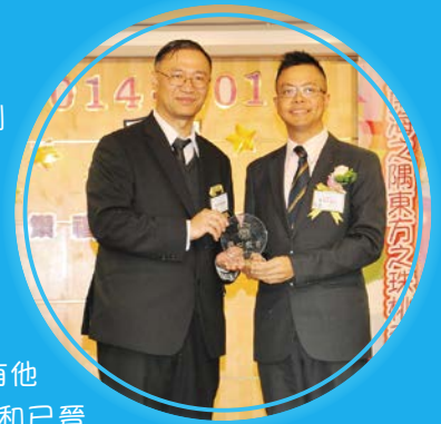
2015年4月18日是本校「校友重聚日暨校友會會員大會」，當天李陞小學校友會理事會成立。

我期望在未來的日子，校友會能為母校作出貢獻。我們需要大家的支持和鼓勵；我們會收集大家的意見，匯集各方的力量，團結各屆校友，維繫情誼，回饋母校。