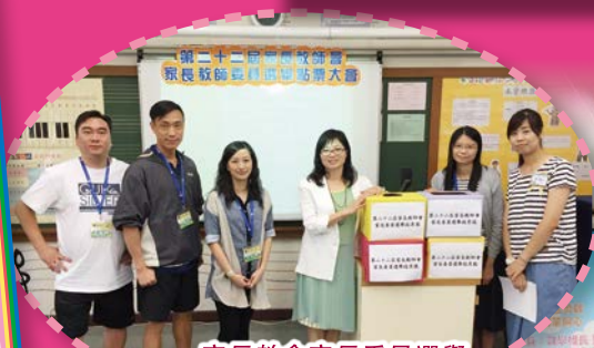
家長教會家長委員選舉及點票程序順利完成

感謝學校重視學生家長對學校教育的參與，為家長舉辦多種親子活動和講座。學校邀請了善於培育子女的金牌DJ車淑梅女士主講「共建快樂家庭·攜手發放正能量」，使各位家長都獲益良多，使我們在教育子女方面，得到新的啟發和認知。我們要多作關懷，驅走自以為是，不要因對子女的期望過高而管教過嚴，以致各走極端。