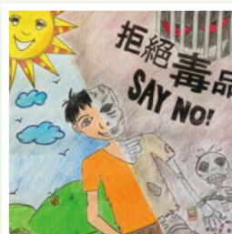
中西區滅罪宣傳創作比賽亞軍 3A 郭旆言