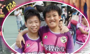
合作無間，出生入死的好隊友!