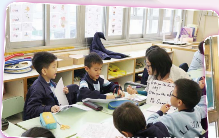
NET Section 支援老師定時到校與小四英文科老師及NET進行備課及觀課活動。

為優化老師的教學效能，以配合課程發展方向，校方特意安排到校專業支援服務，當中包括數學科校本支援計劃(小四及小五)和外籍英語教師支援計劃(讀寫範疇)—Key Stage II Intergration Programme(NEW KIP for P.4)。科任老師定時與該科的課程發展主任進行備課、觀課及評課，參與的教師建立了一個彼此學習及反思教學策略的學習平台，此舉有效促進教師組成專業及積極的學習社群。