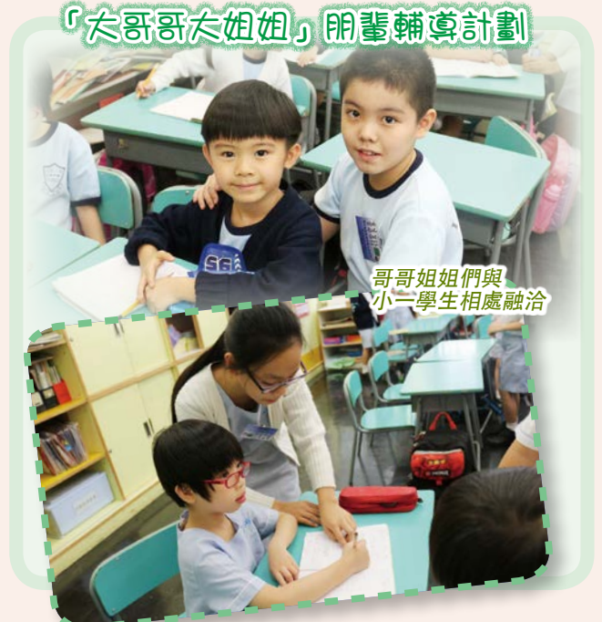
哥哥姐姐們與 小一學生相處融洽