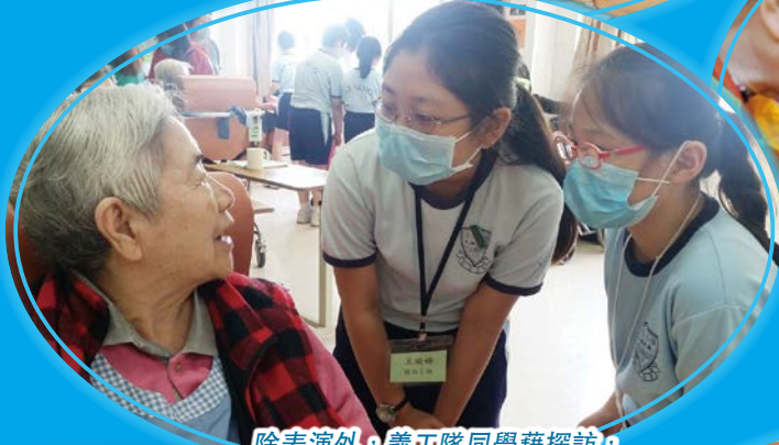
除表演外，義工隊同學藉探訪，表達對長者的關懷。