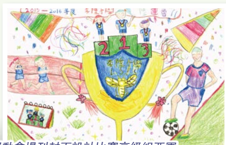
運動會場刊封面設計比賽高級組亞軍 5A 鄒桐