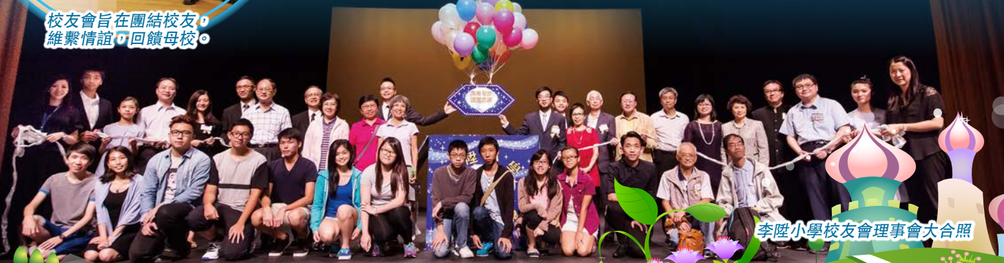
李陞小學校友會理事會大合照