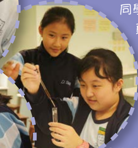
黃加上紅就會變成藍，千古不變的定律