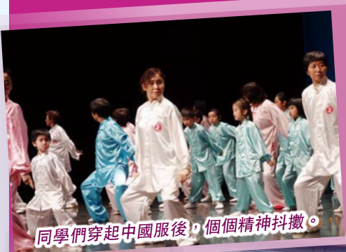
同學們穿起中國服後，個個精神抖擻。