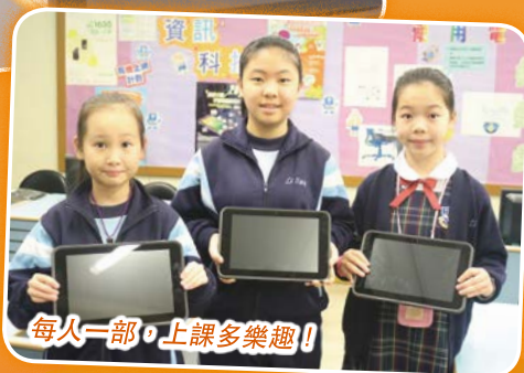
每人一部，上課多樂趣！

好消息！本校已獲教育局批出撥款進行「wifi 900」工程！根據本校計劃，15-16年度學校先進行網絡覆蓋工程、購買平板電腦供學生學習一至六年級電腦科使用電子書上課。16-17年度會擴展至三、四年級常識科，17-18年度再推至二至五年級常識科及二年級數學科使用平板電腦進行學習。從進度看，本年度的計劃已完全達標，全校每一處都已有無線網絡覆蓋(獨立專線，200MB)，平板電腦亦已就緒，學生將會嘗試運用平板電腦進行學習。時代更新，教學模式將會不斷轉變，本校亦會與時並進，將新的觀念引進學校。展望將來，每位學生都能「BYOD」(bring your own device)，再不用背着沉重的書包上學去，而是輕輕鬆鬆，每人手執一部平板電腦，一個小書包已足夠了！