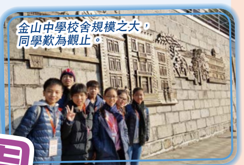
金山中學校舍規模之大，同學歎為觀止。