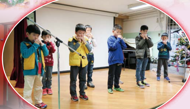
同學們用口琴吹奏聖誕歌，增添歡樂氣氛。