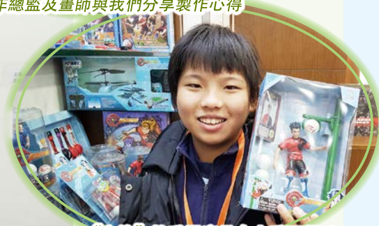
“方塊”的動漫產品令人愛不釋手，大家大開眼界。