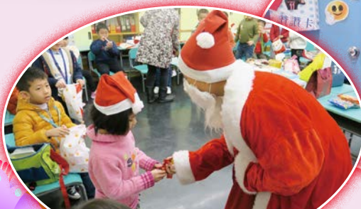
聖誕老人派發糖果給同學，使同學開心不已。