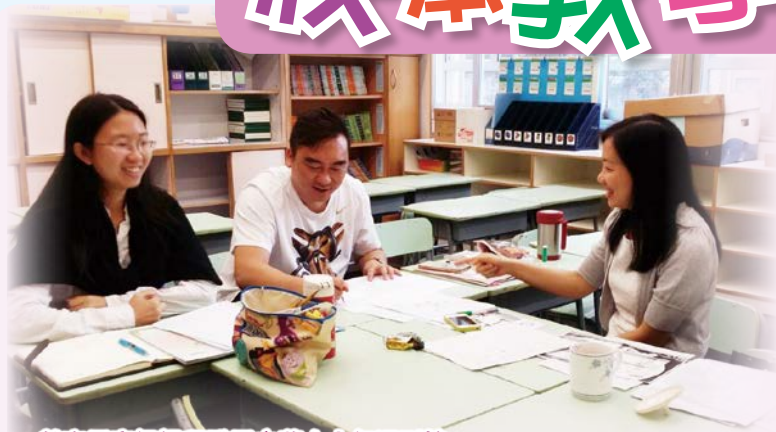
教育局高級課程發展主蕭女士每週到校與數學科老師進行備課會議。

為優化老師的教學效能，以配合課程發展方向，校方特意安排到校專業支援服務，當中包括數學科校本支援計劃(小四及小五)和外籍英語教師支援計劃(讀寫範疇)—Key Stage II Intergration Programme(NEW KIP for P.4)。科任老師定時與該科的課程發展主任進行備課、觀課及評課，參與的教師建立了一個彼此學習及反思教學策略的學習平台，此舉有效促進教師組成專業及積極的學習社群。