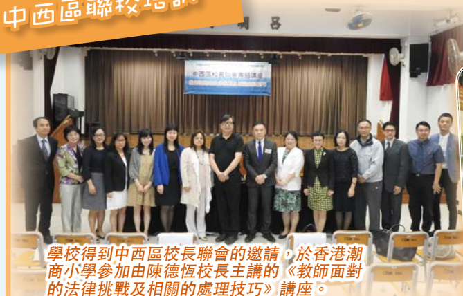
學校得到中西區校長聯會的邀請，於香港潮商小學參加由陳德恆校長主講的《教師面對的法律挑戰及相關的處理技巧》講座。