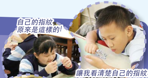
自己的指紋原來是這樣的！