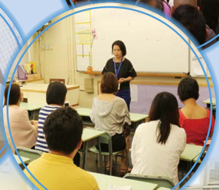
班主任和科任老師為家長簡介學習注意事項，促進家校合作。