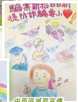
中西區滅罪宣傳創作比賽優異獎 4A 梁賀正