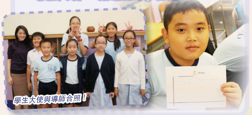
學生大使與導師合照！