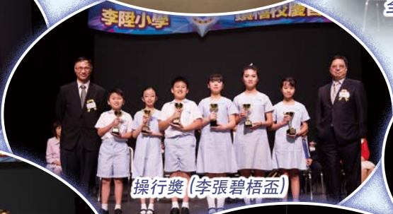
操行獎(李張碧梧盃)