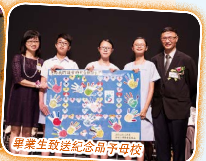
畢業生致送紀念品予母校