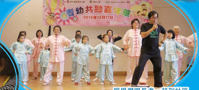
同學們跟長者一起到社區中心表演健體中國舞。