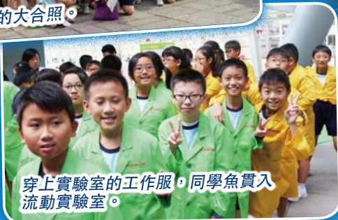
穿上實驗室的工作服，同學魚貫入流動實驗室。