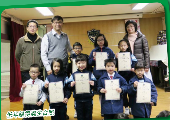
低年級得獎生合照