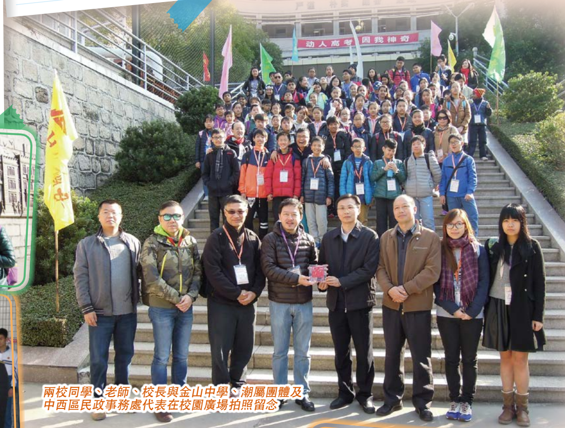
兩校同學、老師、校長與金山中學、潮屬團體及中西區民政事務處代表在校園廣場拍照留念