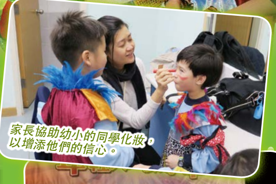
家長協助幼小的同學化妝，以增添他們的信心。