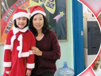
聖誕小女孩打扮嬌俏可愛，老師也禁不住跟她來個合照。