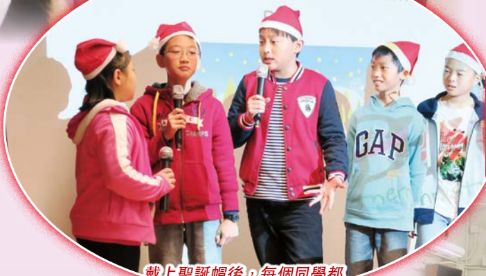
戴上聖誕帽後，每個同學都化身成為小小聖誕老人。