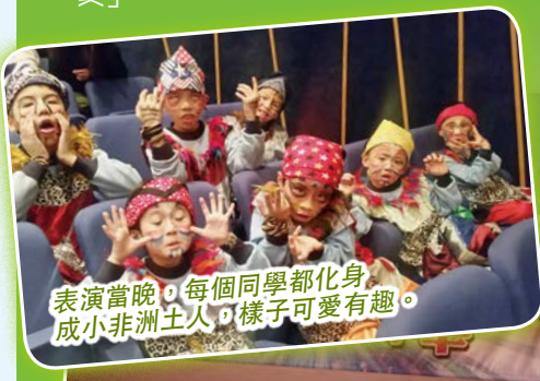
表演當晚，每個同學都化身成小非洲土人，樣子可愛有趣。