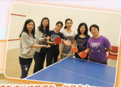
教師到中山公園室內運動進行球類運動，舒展身心。