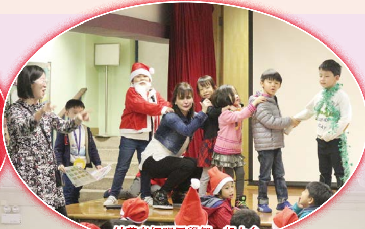
外籍老師跟同學們一起上台，表演話劇，氣氛熱鬧。