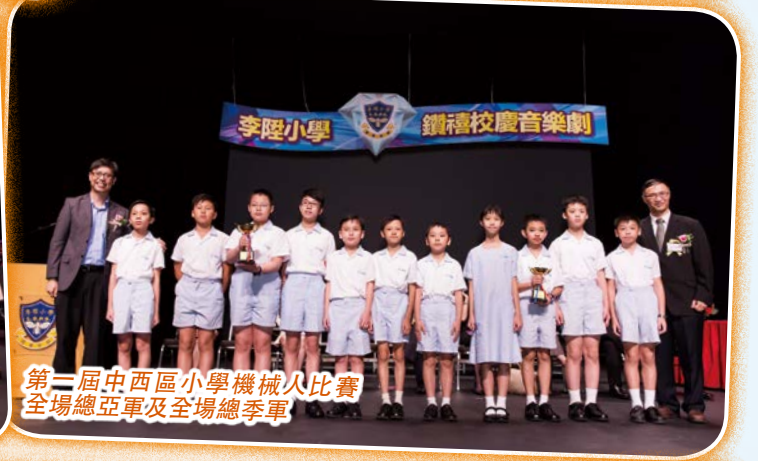
第一屆中西區小學機械人比賽全場總亞軍及全場總季軍