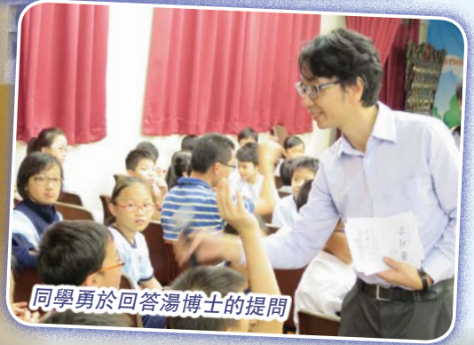
同學勇於回答湯博士的提問