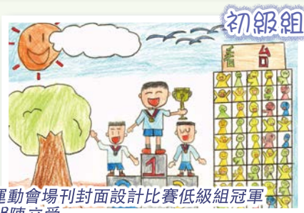
運動會場刊封面設計比賽低級組冠軍 3B 陳立舜