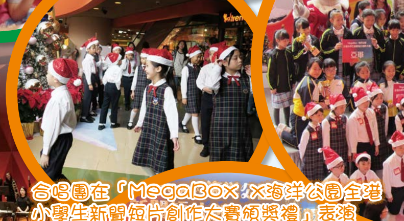
合唱團在「MegaBox x 海洋公園全港小學生新聞短片創作大賽頒獎禮」表演