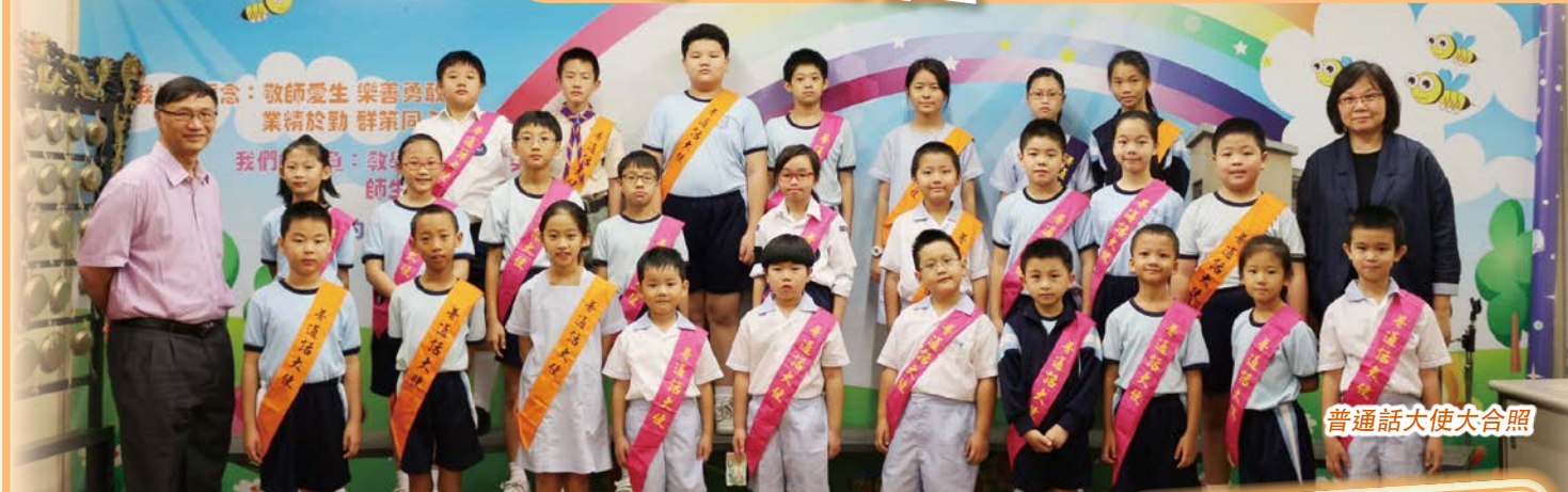
普通話大使大合照

為提升同學們聽、說普通話的能力，普通話科透過不同的活動，鼓勵同學在課堂以外，多聽多說普通話。