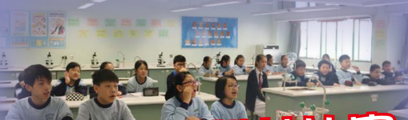
小心小心，千萬不可弄錯！