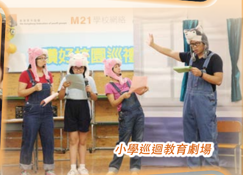
小學巡迴教育劇場