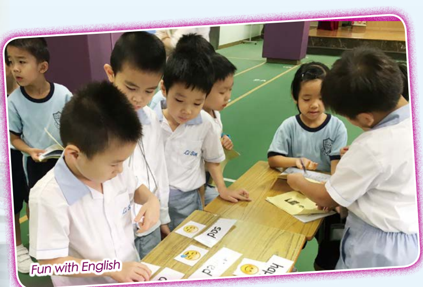
Fun with English