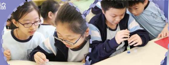
讓我看清楚自己的指紋！