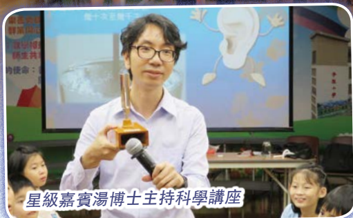
星級嘉賓湯博士主持科學講座