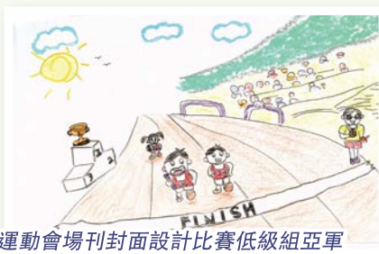
運動會場刊封面設計比賽低級組亞軍 2A 蘇俊然