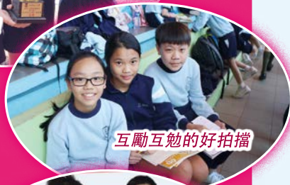
互勵互勉的好拍檔