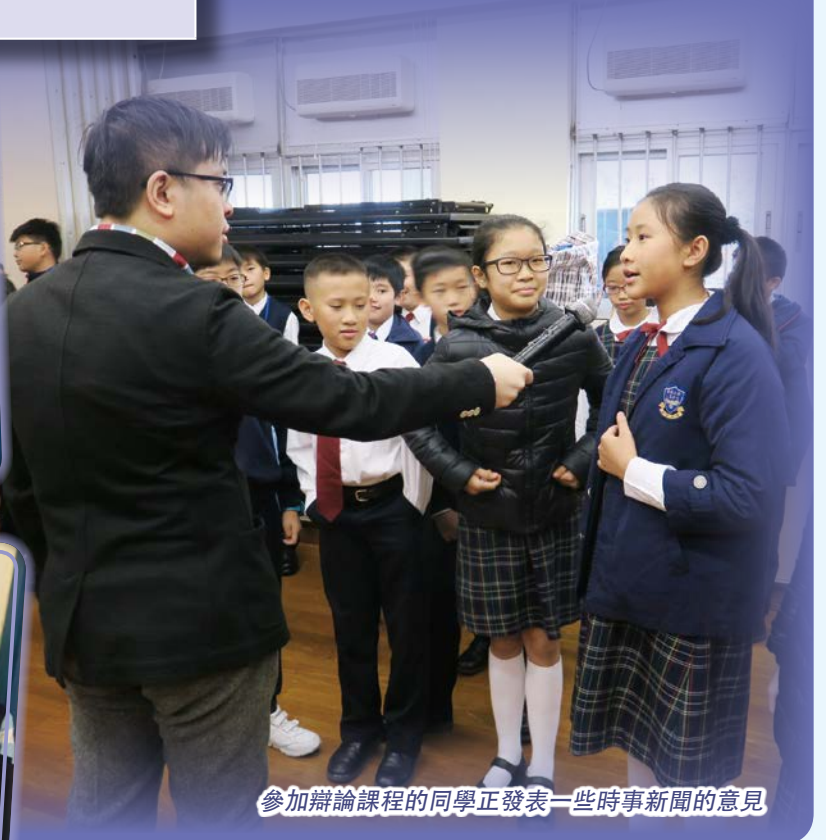
參加辯論課程的同學正發表一些時事新聞的意見