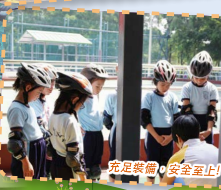
充足裝備，安全至上！