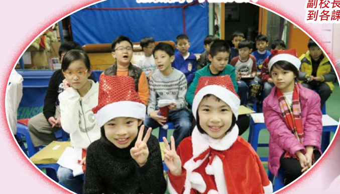
每個同學都穿上自己喜愛的服飾來參加聖誕聯歡會。