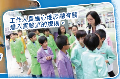
工作人員細心地聆聽有關進入實驗室的規則。