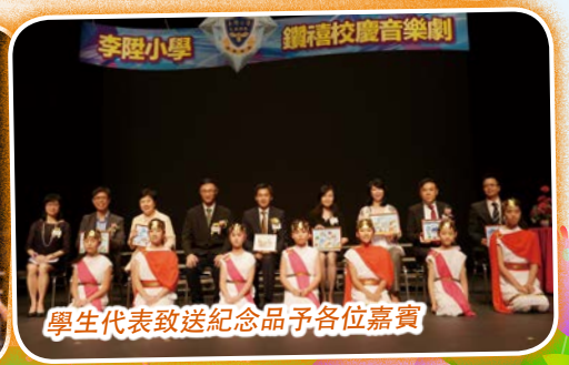
學生代表致送紀念品予各位嘉賓