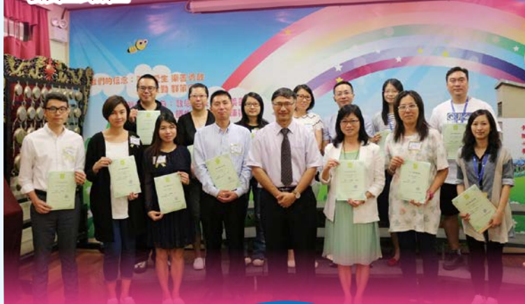
第三十三屆家長教師會委員正式成立