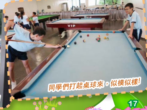
同學們打起桌球來，似模似樣！