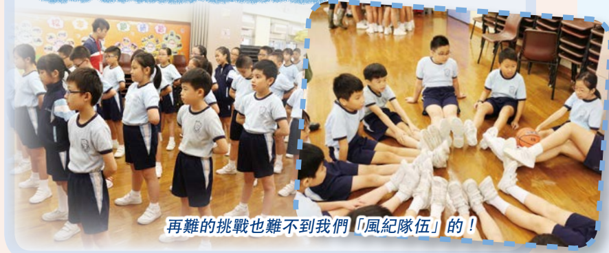
再難的挑戰也難不到我們「風紀隊伍」的！