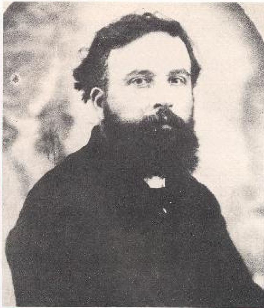
亨利 盧梭 Henri Rousseau (1844 ~ 1910)