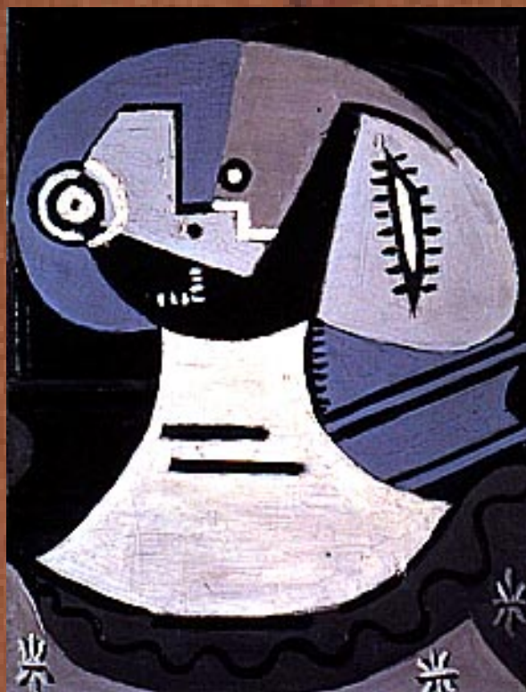
穿花邊圓領的女人