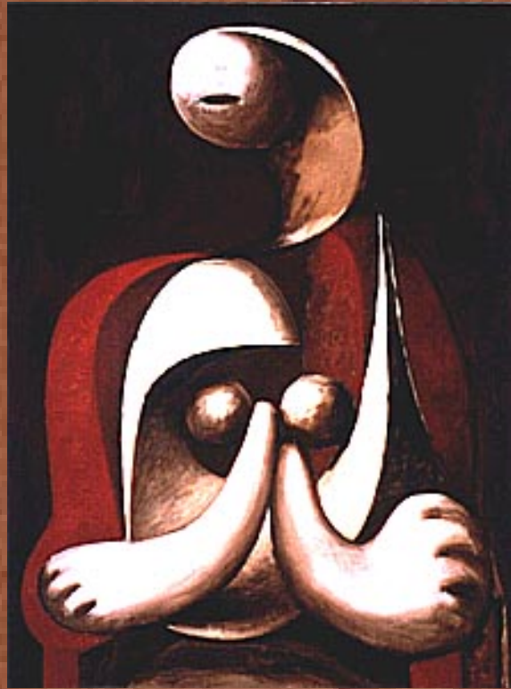
坐在紅色扶椅裡的女子