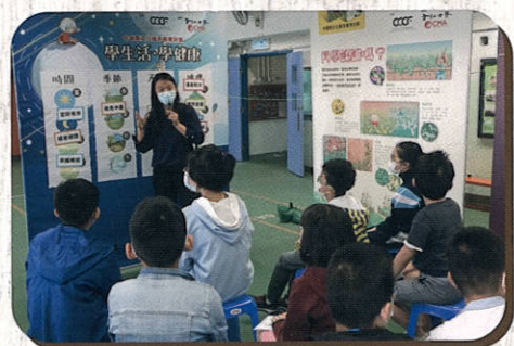
與中醫藥有關的遊戲活動

為培養學生良好的健康文化認知，以及強化他們對中醫藥文化的認同，本校安排學生參加一個有關中醫藥文化與健康生活的講座，由中醫師講解分享，學生參加遊戲和展覽等活動，從而認識中醫藥文化的基礎知識和發掘箇中樂趣，對他們的成長有莫大裨益。