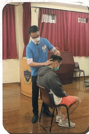
醫師親身示範穴位按壓技巧