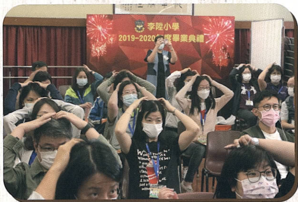
教師及家長全情投入親身嘗試穴位按壓

中醫藥是中華文明其中一塊瑰寶，是五千多年文明的結晶，凝聚著中華民族的博大智慧，本校旨在讓家長、學生及教師從對現代中醫藥文化的認識，進而更了解中華文化的智慧。