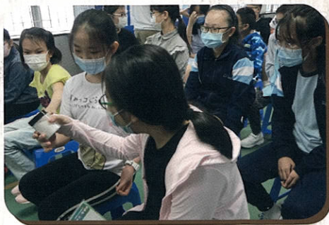
學生初次接觸中藥