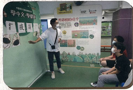
與中醫藥有關的遊戲活動

此外，學生透過閱讀與中醫藥文化有關的繪本，從而明白到大自然與自己的關係，更讓他們學懂珍惜來自大自然的中藥。當中一位學生告訴校長：「我平日看到中藥的顏色是烏黑黑的很可怕，原來他們都是天然的植物，我以後不怕中藥了！」由此可見，繪本確實讓學生對中藥有了初步認識，拉近了他們與中醫藥知識的距離，也開啟了學生從生活了解中華文化的大門，使學生獲益良多。