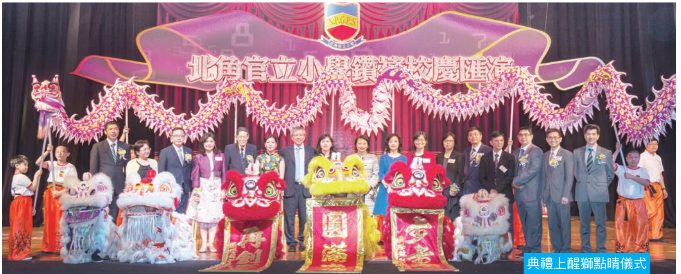
典禮上醒獅點睛儀式

2014年7月3日，本校假座北角新光戲院大劇場舉行鑽禧校慶滙演—「能量密碼」，我們有幸邀請到本校校友，立法會議員李國麟及教育局常任秘書長謝凌潔貞分別擔任午間場及晚間場的主禮嘉賓。在這次滙演中，北官的嘉賓、師生、校友、家長合成一股積極的能量，造就這次既精彩又令人懷念的滙演。學生在舞台上優秀的表現亦體現了北官孩子的「能量密碼」—在關愛的學習環境中堅毅地成長，發揮潛能。