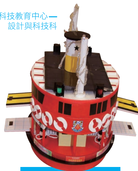
創造型設計冠軍作品

是次比賽，承蒙九龍城區青年事務委員會、青年活動統籌委員會及香港賽馬會慈善信托基金撥款資助，還有本中心設計與科技科員工眾志成城、盡心盡力地籌備及推行，才得以順利圓滿完成，謹向各機構及所有參與者致謝。