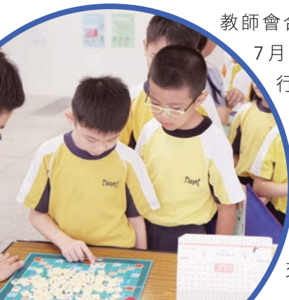
Scrabble 大門法，同學非常投入

增強學生的語文能力，提升說話技巧，帶動語言學習氣氛，屯門官立小學、南屯門官立中學及兩校家長教師會合辦「英普同樂日」。活動於7月7日在屯門官立小學校園舉行。透過攤位遊戲、分組協作學習以及互動英語劇場等多元化的學習活動，為校園營造良好語言環境和豐富學習經驗，並加強同區官立中小學師生的聯繫及增進交流。