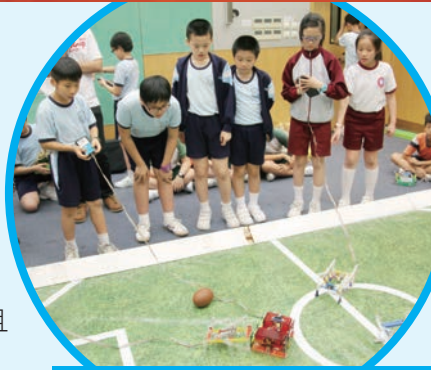
足球賽事緊張刺激

參觀香港理工大學機械工程系。透過教授的講解及參觀大學校園先進的科技和教學設備，如實驗室、研究中心等，了解科技的應用，並且擴闊學生的視野。