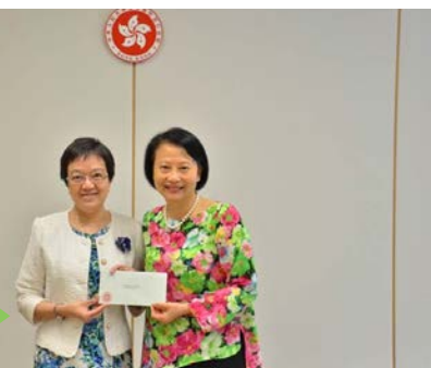
康陳翠華女士（左）及謝凌潔貞女士

康陳翠華女士於2014年5月14日獲晉升為教育署助理署長。在接過升職通知書後與教育局常任秘書長謝凌潔貞女士合照。康女士現任首席助理秘書長（質素保證及校本支援）。