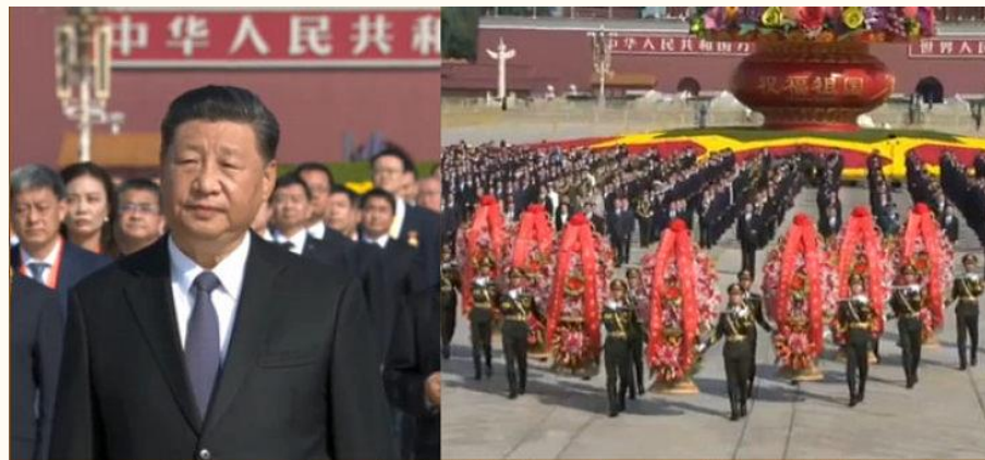
習近平出席烈士紀念日儀式 紀念近代為國捐軀2千萬烈士

據不完全統計，約有2000萬名烈士，他們為民族獨立、人民解放和國家富強、人民幸福英勇犧牲。由於戰爭年代條件有限許多先烈沒有留下姓名。目前，全國有名可考、並收入各級《烈士英名錄》的僅有193萬餘人。近幾年，每年新評定的烈士數量在300人左右。